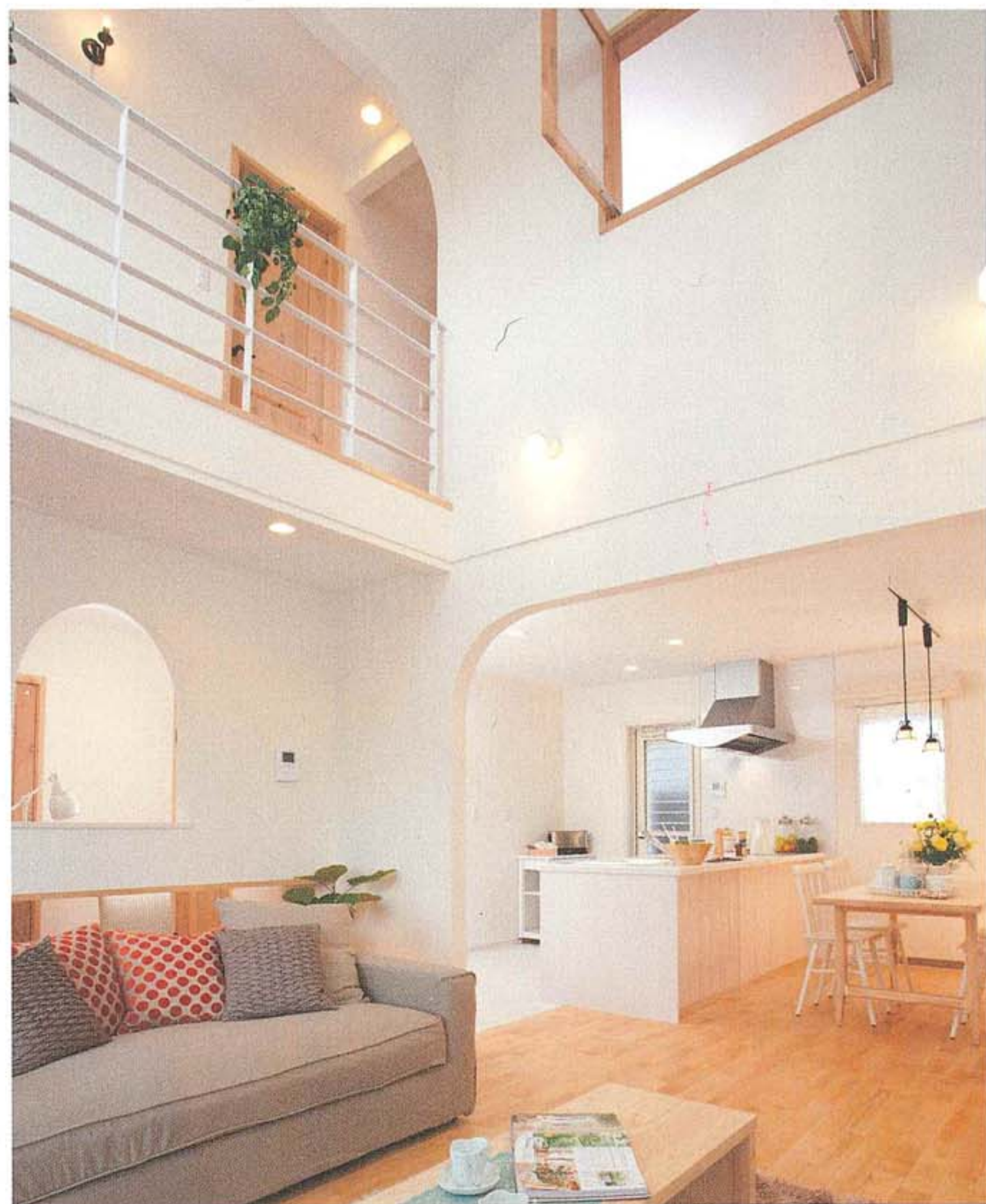
南欧のテイストを取り入れた、開放的な吹き抜けのリビング。ディテールにも遊びが散りばめられている