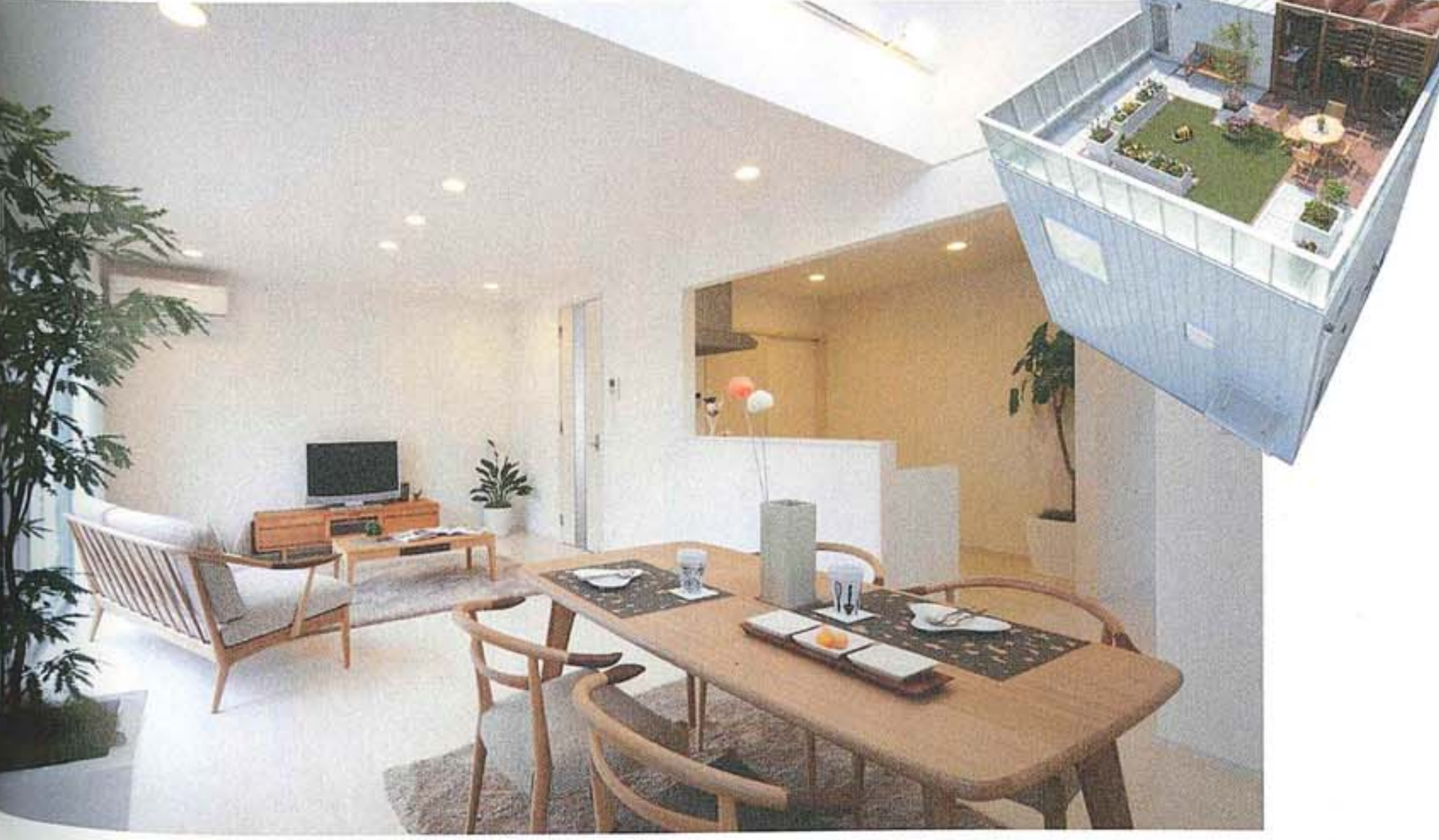
吹き抜けから明るい光が射す快適なゼロキューブのリビングルーム