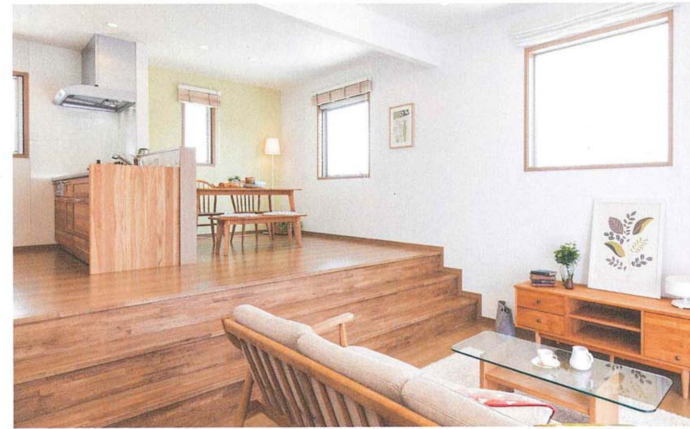
変化のあるスキップフロアの内部空間は、常に子どもの気配を感じていられる

スカイバルコニーをはじめ、ライ フスタイルに合わせたオプショ ンで空間を拡張できる